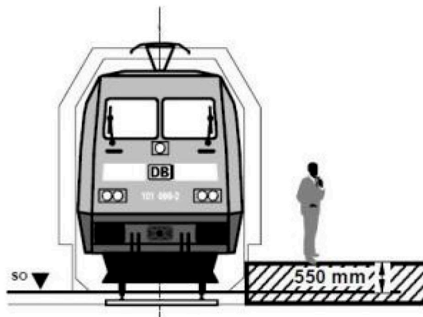
Mittlere Bahnhöfe (25-200 Züge/Tag, IR- und E-Halt)