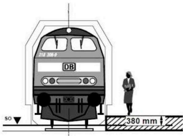
Kleine Bahnhöfe (unter 25 Züge/Tag, N-Halt)