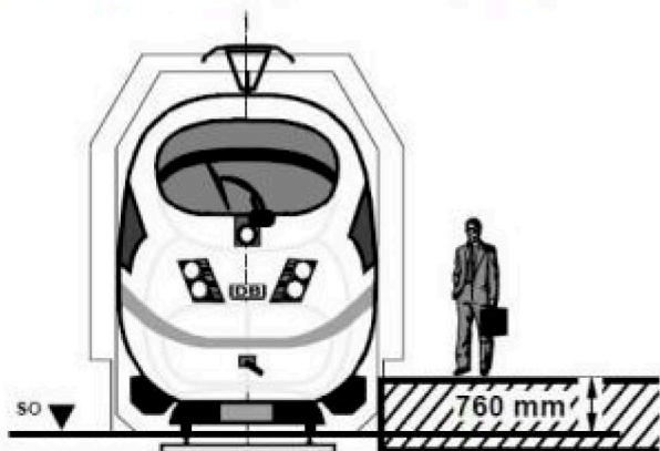
Große Bahnhöhe (über 200 Züge/Tag, ICE-Halt)